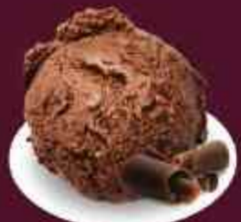
BELGIAN CHOCOLATE เบลเยี่ยม ช็อกโกแลต