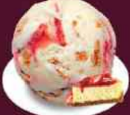
STRAWBERRY CHEESECAKE สตรอว์เบอร์รี่ชีสเค้ก