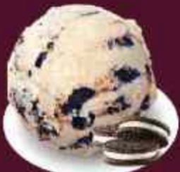
COOKIES & CREAM คุกกี้แอนด์ครีม