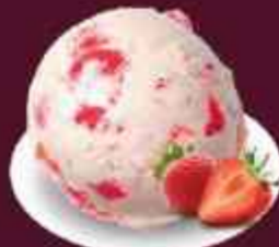
STRAWBERRY สตรอว์เบอร์รี่