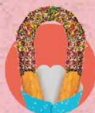
RAINBOW SPRINKLES CHOCOLATE